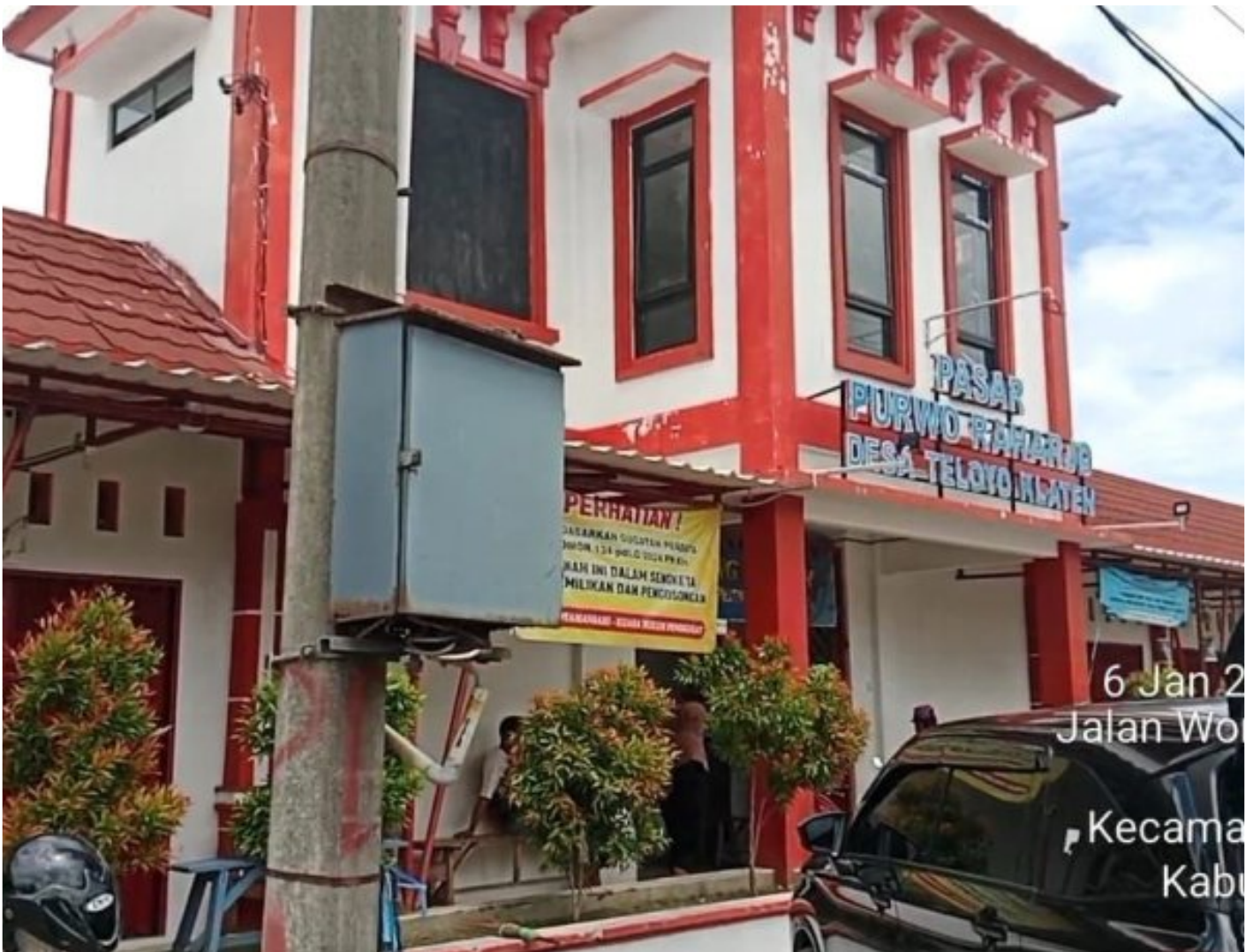
Foto: Pasar Purwo Raharjo di Desa Teloyo, Kecamatan Wonosari, Kabupaten Klaten, kembali memicu perhatian publik.

KLATEN - Polemik sengketa tanah Pasar Purwo Raharjo di Desa Teloyo, Kecamatan Wonosari, Kabupaten Klaten, kembali memicu perhatian publik.